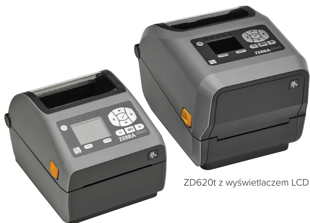
ZD620d z wyświetlaczem LCD

Kiedy istotne znaczenie ma jakość druku, produktywność, elastyczność zastosowań i prostota zarządzania, drukarka Zebra ZD620 sprawdzi się znakomicie. Należący do nowej generacji drukarek biurkowych Zebry model ZD620 zastępuje popularne drukarki z gamy GX Series oraz ZD500. Jest to coś więcej niż tylko konwencjonalna drukarka biurkowa – zapewnia ona najwyższą jakość druku i supernowoczesne funkcje. Model ZD620 jest dostępny zarówno w wersji do druku termicznego, jak i termotransferowego, a także w wersji dla służby zdrowia i doskonale sprawdzi się w wielu różnych zastosowaniach. Drukarki te wyposażone są w większość standardowych funkcji drukarek biurkowych marki Zebra oraz oferują opcjonalny 10-przyciskowy interfejs użytkownika z kolorowym wyświetlaczem LCD, dzięki któremu proces konfiguracji i odczytywania stanu drukarki nie będzie już trzeba opierać na zgadywaniu. Drukarka ZD620 działa pod systemem operacyjnym Link-OS® i jest obsługiwana przez Print DNA – nasz zaawansowany zestaw aplikacji, programów narzędziowych i narzędzi dla programistów, który zapewnia najwyższej jakości środowisko druku dzięki lepszym wynikom, prostszemu zarządzaniu zdalnemu oraz łatwiejszej integracji drukarek. Zebra ZD620 – szybkość i jakość druku oraz łatwość zarządzania drukarką niezbędne Twojemu przedsiębiorstwu do rozwijania działalności.